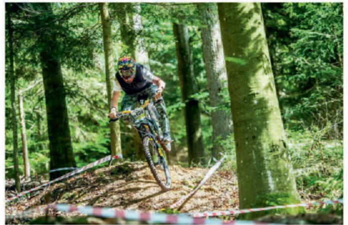
Das Ehepaar Šrail

DANKE AN DIE GEMEINDE SILBERBACH FÜR IHRE UNTERSTÜTZUNG!